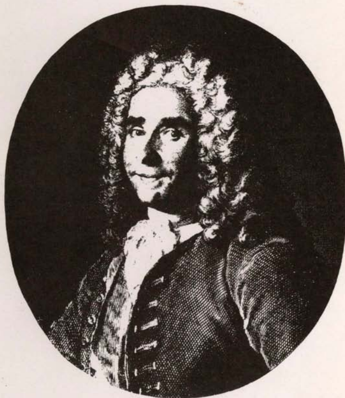
Portrait de Réaumur par Jean-Jacques BALECHOU

année du tricentenaire de la naissance de